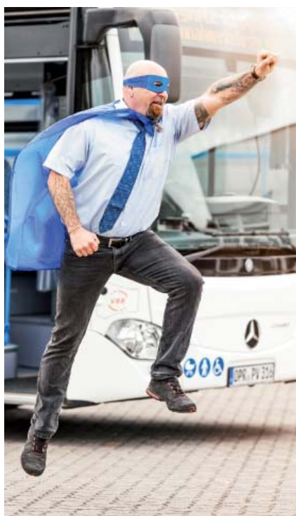
Quereinsteiger-Werbung der ORP.