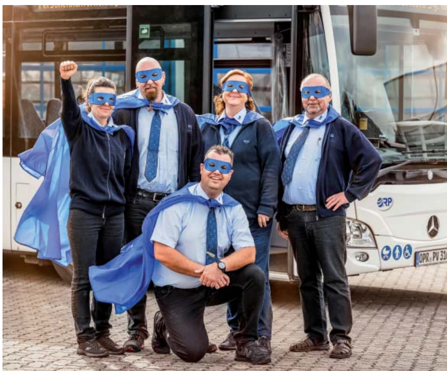
Diese Frauen und Männer freuen sich auf Verstärkung.